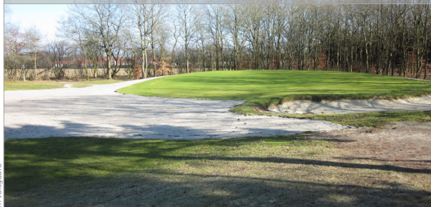
Hul 3 - 26. februar 2013