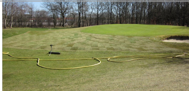
Hul 3 - 20. april 2013